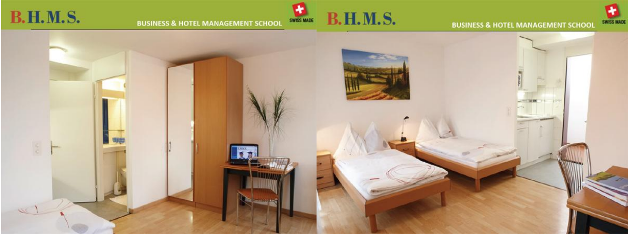
ตัวอย่างห้องพักนักเรียน